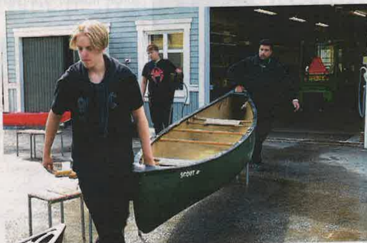
Kruunupyyn kansanopiston kymppioppilaat viihtyvät opinahjossaan, joka tarjoaa paljon ulkoilmaopetusta ja retkeilyä.